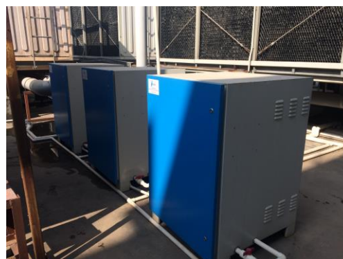
非嵌入式電磁波水垢清除系統