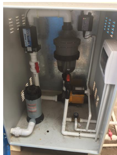
非嵌入式電磁波水垢清除系統

工廠使用12台冷水式中央空調系統，為全廠生產車間提供冷氣。空調水塔冷卻水揮發量大，產生大量水垢長期影響設備熱交換效率，令用電量提高及設備維護要求偏高。友邦經常面對上述問題，因此積極尋找方案以減少生產損失及資源浪費，亦可提升生產力及節能維護的相關環保效益。